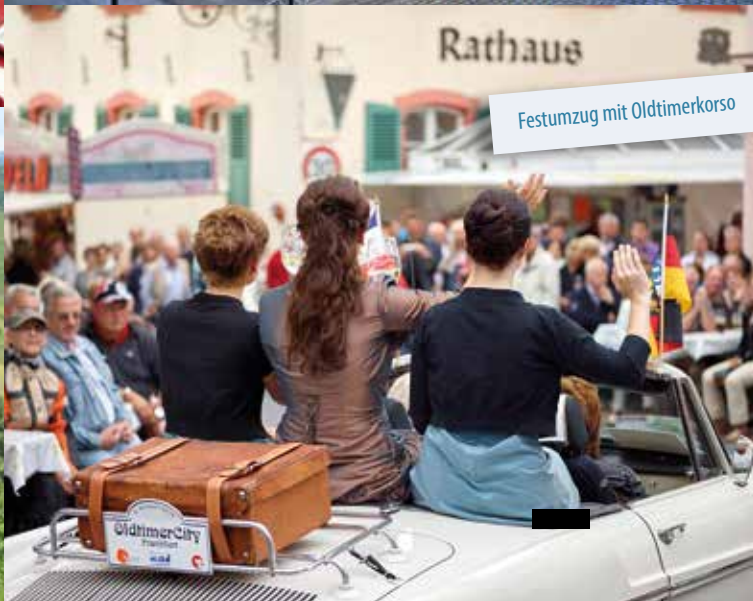
Festzug mit Oldtimerkorso