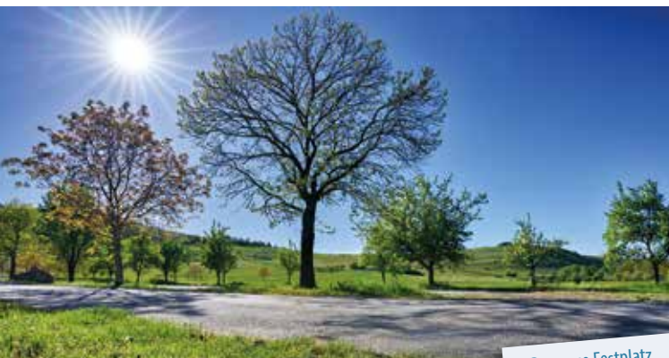
Der neue Festplatz