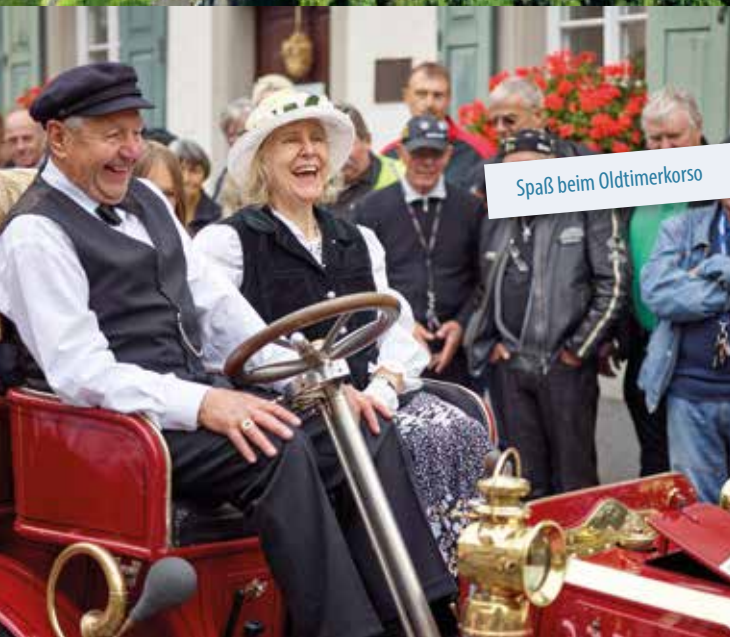
Spaß beim Oldtimerkorso

mit 46. Oldtimersternfahrt vom 24. bis 26. Juli 2026