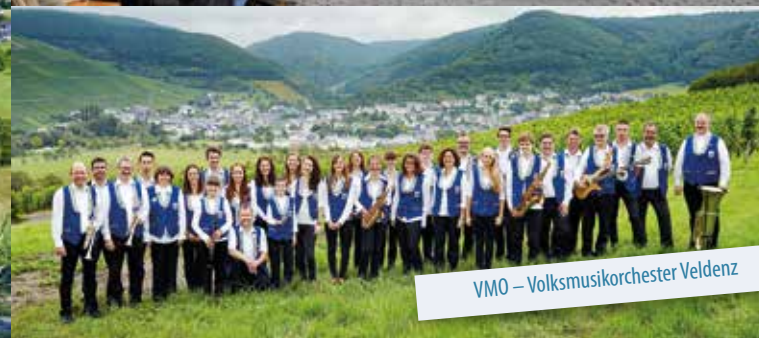
VMO – Volksmusikorchester Veldenz