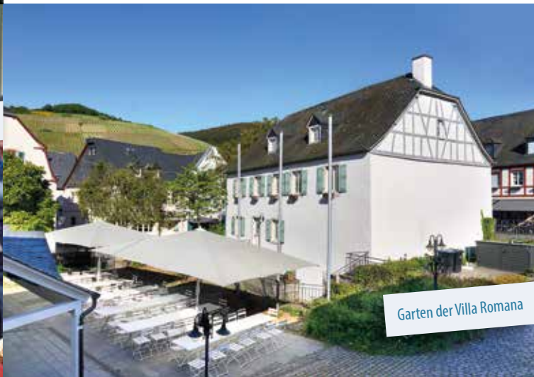
Garten der Villa Romana