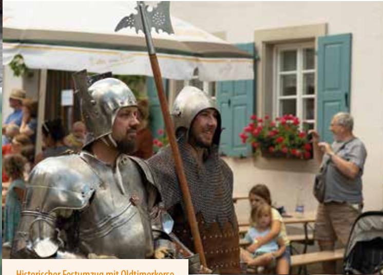
Historischer Festumzug mit Oldtimerkorso